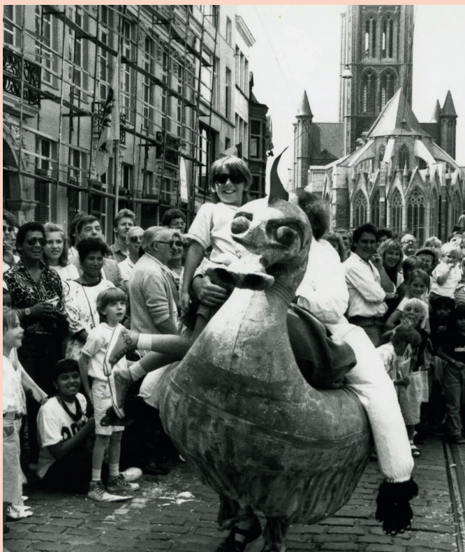
Openingsstoet Gentse Feesten, 1989